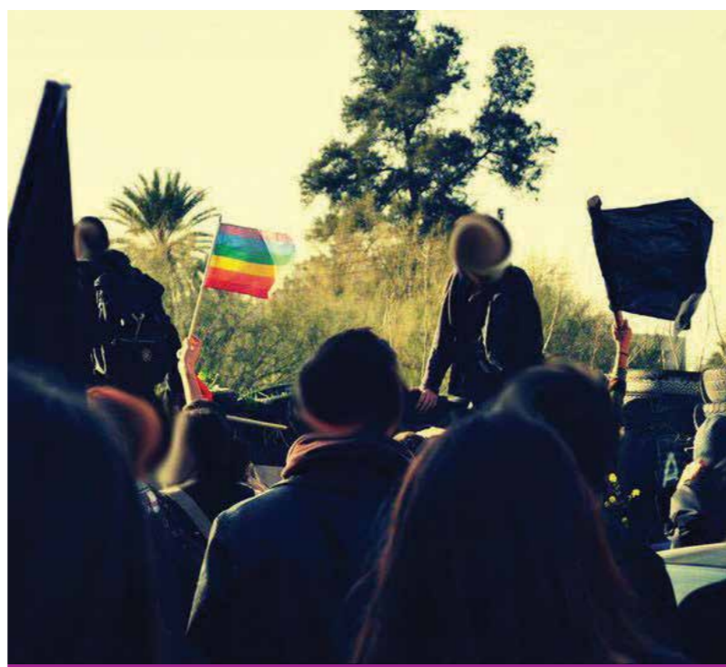
Πορεία για μια Αποστρατιωτικοποιημένη Λευκωσία, 19 Φεβράριου 2011